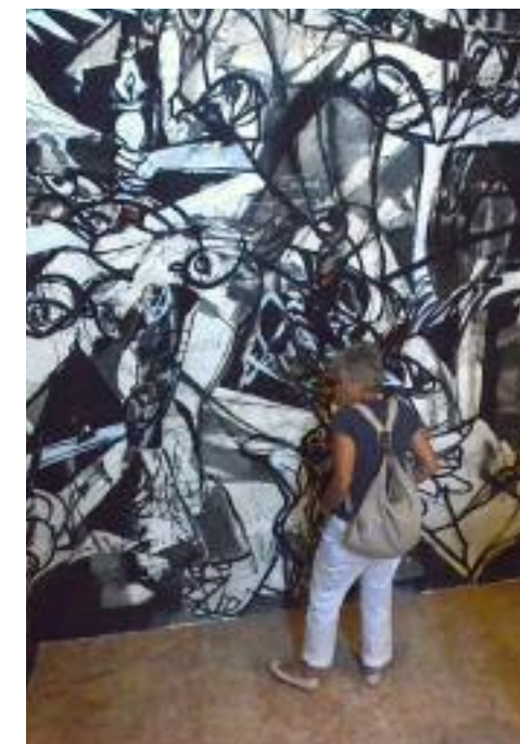
Exposition à Brignoles. 2012.