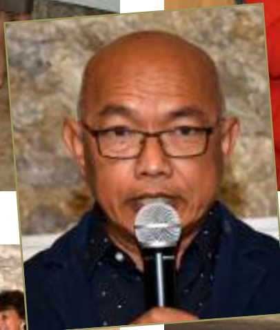
Sama : «habiter poétiquement le monde».