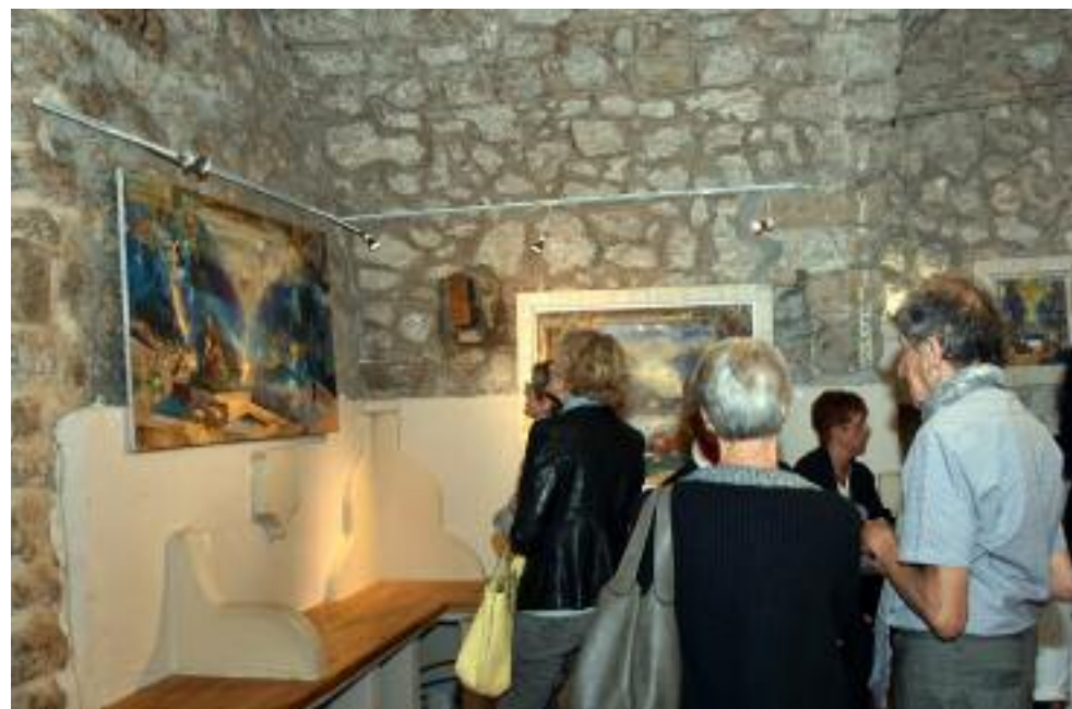
Vernissage.Vendredi 19 octobre 2018.