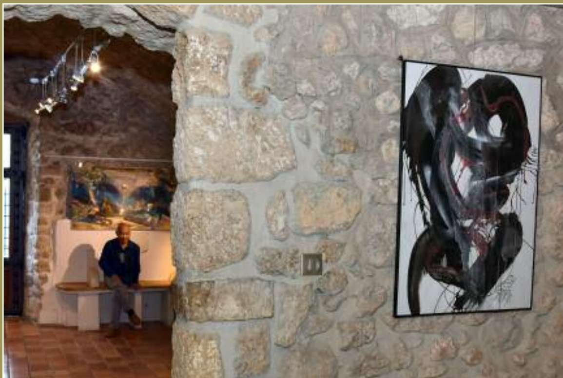
Sama. Château de Bouc-Bel-Air. Octobre 2018.