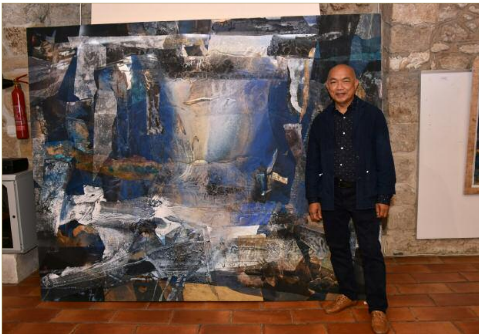
Sama. Château de Bouc-Bel-Air. Octobre 2018.