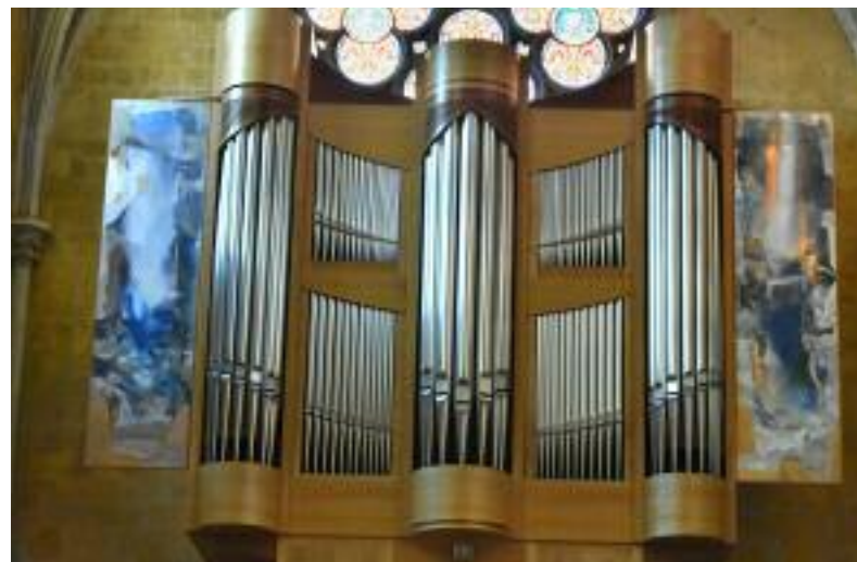
Panneaux d'encadrement du buffet d'orgues. Église Saint-Jean-de-Malte. Aix-en-Provence.